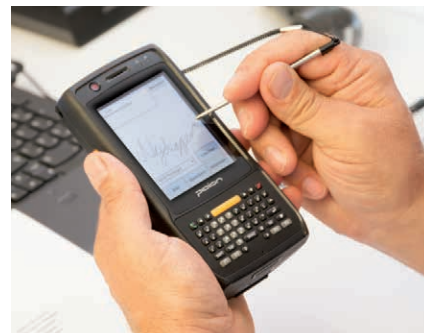
Isitrac multifonctionnel: de la géolocalisation à la saisie numérique de la signature.