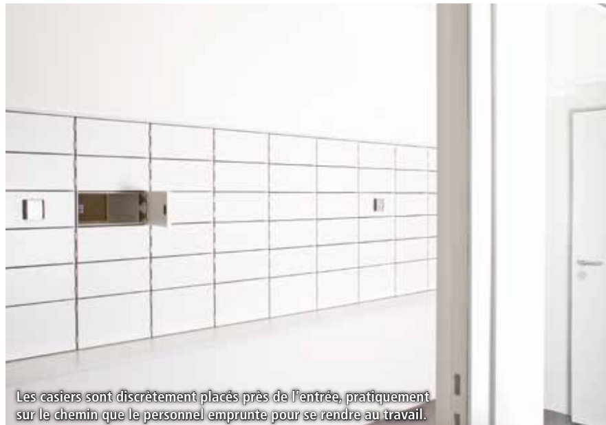
Les casiers sont discrètement placés près de l'entrée, pratiquement sur le chemin que le personnel emprunte pour se rendre au travail.

« Nous avons concrétisé mon vœu: une solution intégralement viable au quotidien. Syspost nous a bien conseillé – et le personnel s'est adapté en un clin d'œil au nouveau système! »